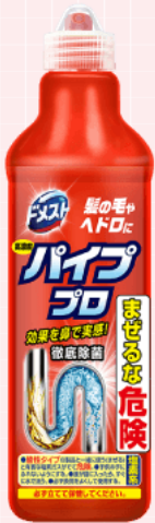
ドメスト パイププロ