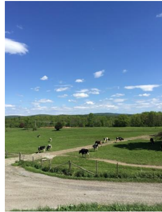
上:バーモント州にあるベン&ジェリーズの契約酪農場

*アイスクリームショップを22か国で展開しているほか、小売のみの展開を15か国で行っています。