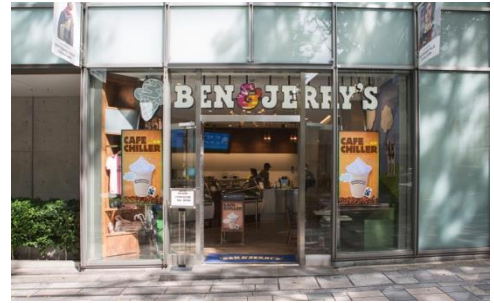
上:表参道ヒルズ スcoopショップ

アメリカ・バーモント州で生まれたスーパープレミアムアイスクリーム「ベン&ジェリーズ」は、1978年、アイスクリームが大好きな2人の青年ベンとジェリーが、ガソリンスタンド跡地に開いた小さなお店から始まりました。ゴロゴロしたチャック(チョコレートやクッキーの具)が入ったユニークなアイスクリームはたくさんの人を虜にし、現在は世界37か国*で展開しています。日本では 旗艦店「表参道ヒルズ店」と「ららぽーと豊洲店」の全2店舗で営業中。関東エリアの一部の高級食料品店や一部のスーパーとコンビニにつづき、関西エリアでも2016年3月からミニカップアイスクリームの販売を開始。店舗は順次拡大中。お店と同じおいしさを、ご家庭でも楽しんでいただけます。