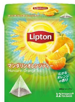
リプトン マンダリンオレンジティー