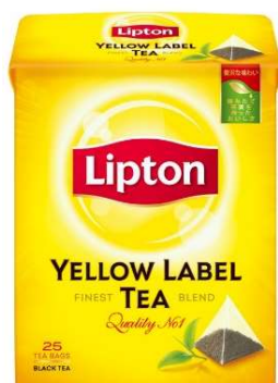
リプトン イエローラベル

提供内容：リプトン製品（リプトン イエローラベル、マンダリンオレンジティー）、ウォーターサーバー、新入社員応援レシポ