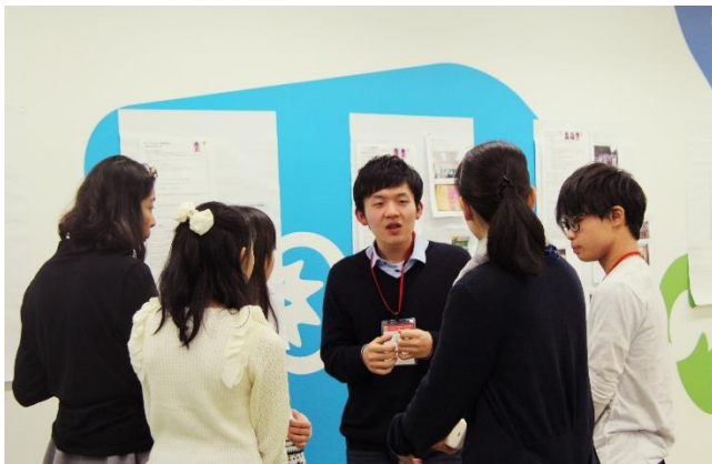
左上:アクションプランを立案する参加者学生(昨年度)

ユニリーバ・ジャパン(本社:東京都目黒区)は、「リプトン」ブランドとして、こども国連環境会議推進協会と連携し、中高生を対象に「食」の現実や課題を考えてもらうプログラム「リプトン サステナビリティ大使プログラム」を昨年に続き開催します。2年目となる今年は、プログラムの期間中、参加者限定のオンラインコミュニティを提供するほか、「リプトン サステナビリティ大使」へ認定された方にさまざまな特典を提供します。