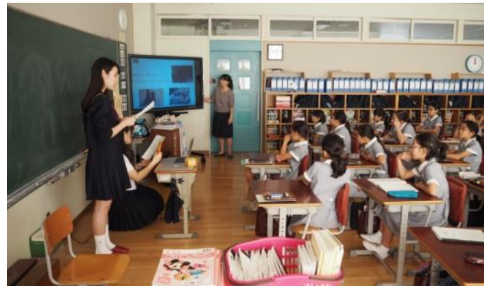
右上:アクションを実施する参加者の様子(昨年度)

この「リプトン サステナビリティ大使プログラム」は、次世代を担う中高生が食を通して環境に配慮することに対し、自ら考え、行動し、発信していける人材になっていくことをサポートすることを目的としています。そのため、1日限りのワークショップではなく、参加者自身が約4ヶ月の間、自らが立てたアクションプランをもとに実際に行動を起こします。