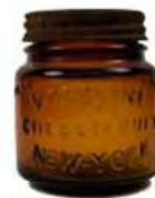
初代ヴァセリンペトロリウムジェリー