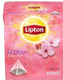
リプトン さくらティー