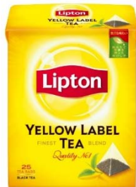
リプトン イエローラベル