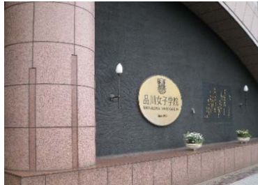
品川女子学院 外観

提供内容：リプトン製品（リプトン イエローラベル、さくらティー）、ウォーターサーバー