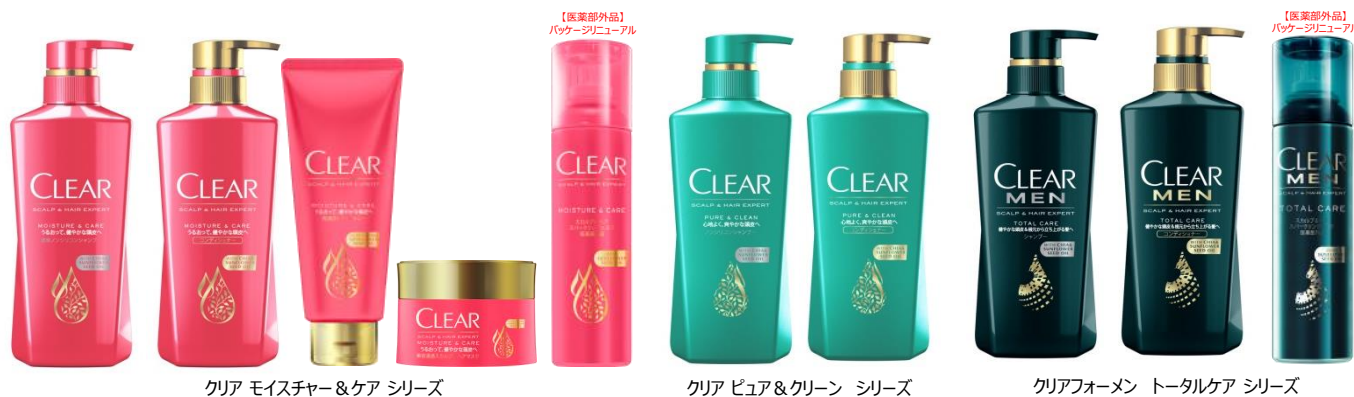
クリア モイスター&ケア シリーズ

ユニリーバ・ジャパンは、スカルプケアブランド「クリア」より、スカルプ&ヘア エキスパートシリーズをそれぞれ「モイスター&ケア」、「ピュア&クリーン」、「クリアフォーメン トータルケア」として、各シリーズ内のシャンプー、コンディショナー、トリートメントをすべて9月11日(月)にリニューアル新発売いたします。新クリアは、ヘアケアではめずらしいスーパーフードに着目。洗うだけではない、贅沢なスカルプケアを。