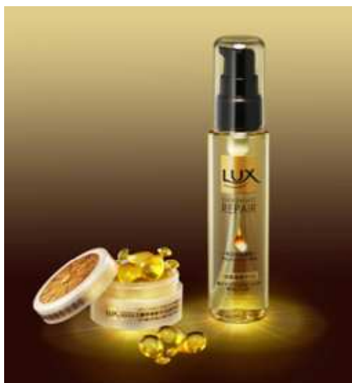
<写真左> ラックス スーパーダメージリペア 濃密補修オイルカプセル