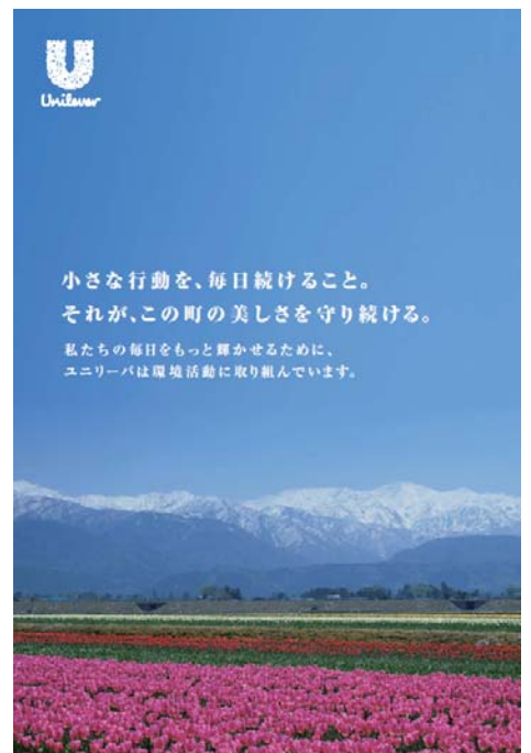
「シクロシティ富山」に掲出する広告

日本法人のユニリーバ・ジャパンは1964年創立。「ラックス」「ダヴ」「ポンズ」「アックス」「ジフ」「ドメスト」「リプトン」など、信頼の高いブランドを日本の消費者の方々へお届けし、ご愛用いただいています。