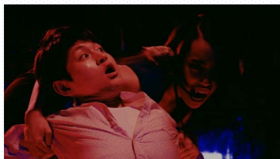
④オオカミの姿に変貌した女性が男性に襲いかかるシーン

※この他のMVカットもご用意しております。ご入用の際はPR事務局までお問い合わせください。