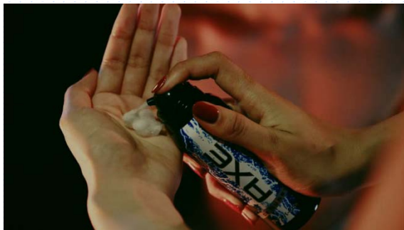
①女性が「アックス アイс パースト」を使い男性の体を冷却するシーン