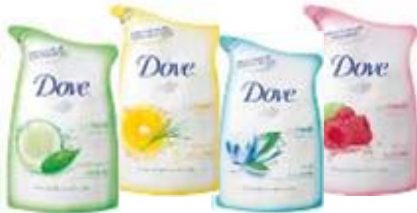
go fresh シリーズ：つめかえ用(4種) 内容量 400ml 価格 オープン価格

環境のことを考えて2個目からは「つめかえ用」を購入する方が多くなっています。新しいDove「go fresh」シリーズでは「つめかえ用」のパウチ層の構成を変更し、使用するプラチック量を従来品よりも11%削減。さらに環境にやさしい仕様に改良しています。