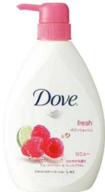
ジューシーベリー&フレッシュライム

go fresh シリーズ: ダヴ ボディウォッシュ リニュー ジューシーベリー&フレッシュライムの香り